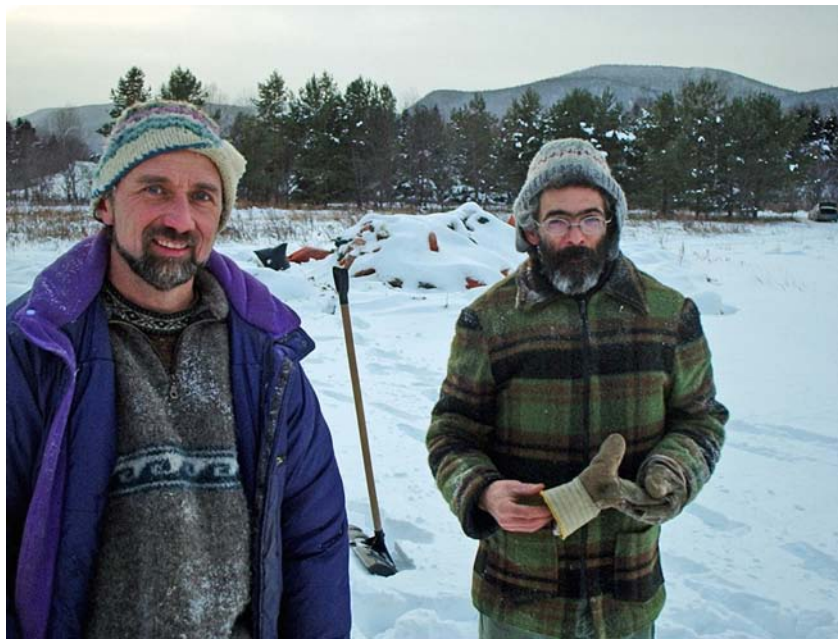
Photo 2 : Agriculteurs très satisfaits du projet Co-compostage à la ferme

Le projet pilote Co-Compostage à la ferme démontre non seulement la faisabilité d'une initiative simple pour réduire la quantité de matières résiduelles vouées à l'enfouissement, mais démontre aussi qu'un déchet pour un, peut être une ressource pour l'autre. Dans un processus de valorisation de matières résiduelles, on remarque fréquemment que les deux parties sont gagnantes. C'est effectivement le cas pour le projet de Co-Compostage à la ferme . Les municipalités et agriculteurs participants sont très satisfaits de l'expérience. Cela nous encourage à redoubler d'efforts pour que cette pratique devienne une habitude à chaque printemps et l'automne. Déjà, plusieurs autres municipalités se sont montrées intéressées à se joindre au mouvement, en espérant que «l'effet boule de neige» continue et s'accélère en intégrant d'autres projets de valorisation de matières résiduelles.